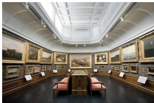
In deze zaal op de tweede verdieping hangen de schilderijen boven elkaar.