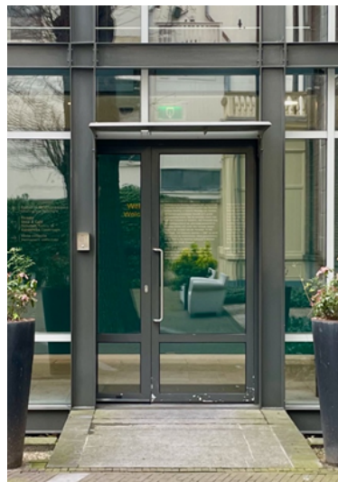
Dit is de entree deur.