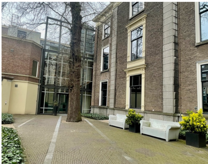
Dit is de hoofdingang vanaf de tuin gezien.