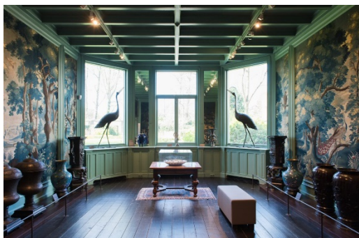
In deze zaal op de begane grond is druk behang te zien.

Het museumgebouw met de vaste collectie heeft aan één kant van het gebouw een trappenhuis. Aan het einde van de eerste en tweede verdieping ga je weer terug naar het trappenhuis om naar boven of weer naar beneden te gaan.